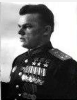
И. Н. Кожедуб