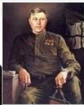
А. И. Покрышкин

В 1943 году Президиум Верховного Совета СССР учредил орден Славы , статус которого был близок к царским Георгиевским наградам, даже внешне орден Славы напоминал Георгиевский крест