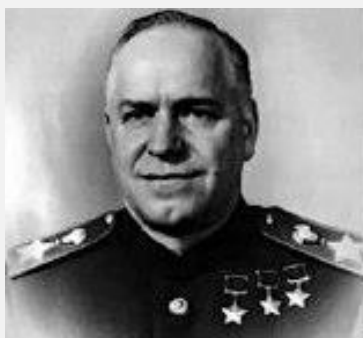
Г. К. Жуков